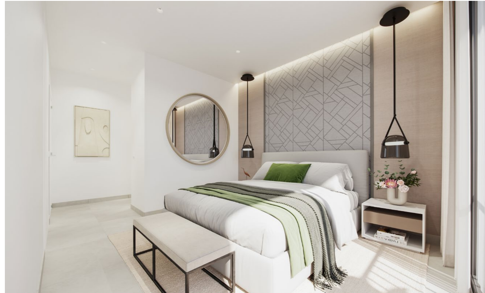
Dormitorio y baño principal master bedroom and bath

Chcemy, abyś każdego dnia budził się z najlepszym widokiem na Costa del Sol. Światło i komfort w najbardziej intymnych przestrzeniach.