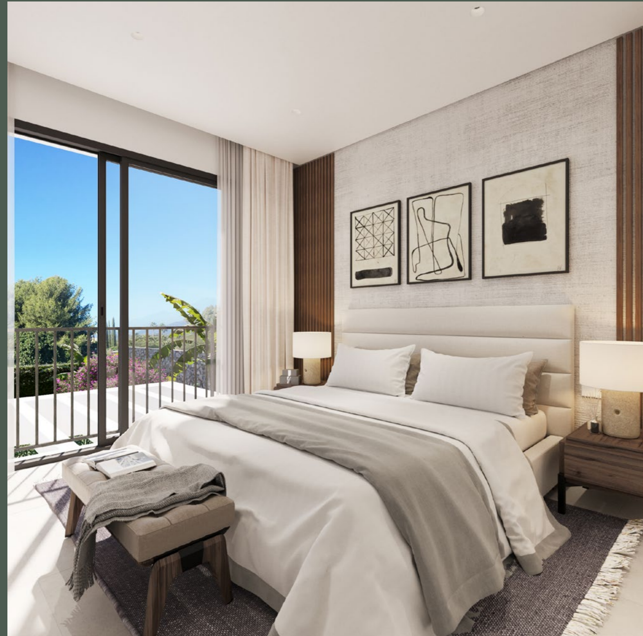
Dormitorio 3 Sypialnia 3